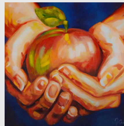
Iskušenje, akril na platnu, 50x50cm