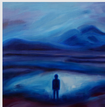
Praznina, akril na platnu, 60x80cm