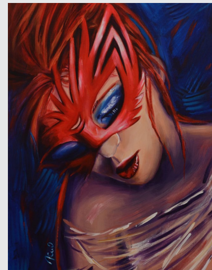
Black Ice, akril na platnu, 70x50cm